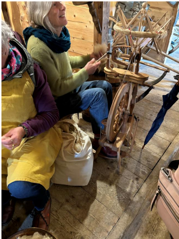
Atelier Laine : cardage, filage, tissage