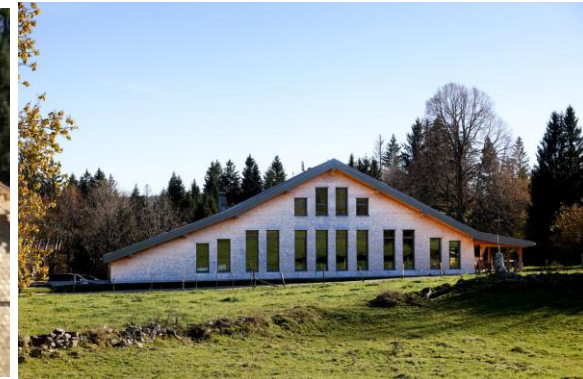
© Romain Poulet et Loïc Gautheret